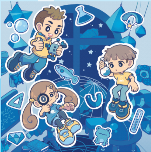
イラスト：犬井トオル