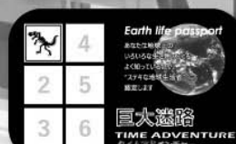
Earth life passport

迷路内には6つのクイズがあり、その答えと思う方向に進む。正解ならばパスポートにスタンプを押して次へ、不正解なら行き止まりだ！ みごとゴールできたら、ミッションクリアとなり、『Earth life passport』の認定シールがゲットできるぞ！